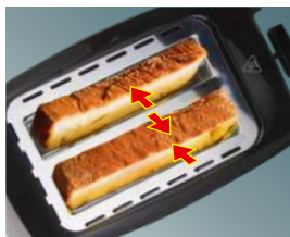
Автоматическое центрирование для равномерного обжаривания