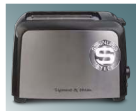
Материал корпуса: пластик/сталь