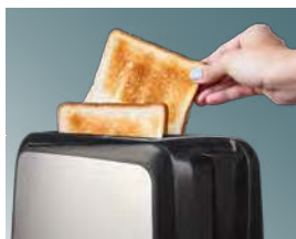
Высокий безопасный подъем тостов