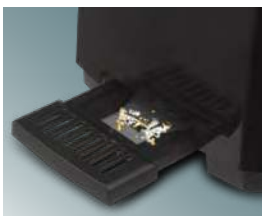
Съемный поддон для крошек