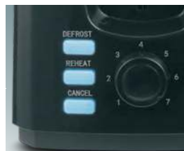
Светодиодная подсветка кнопок