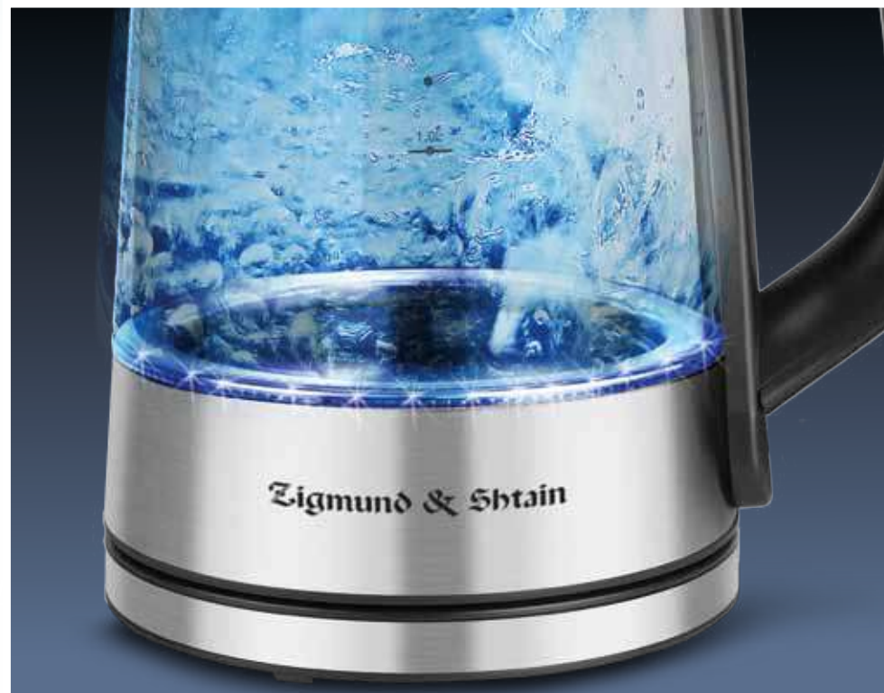
Светодиодная подсветка корпуса