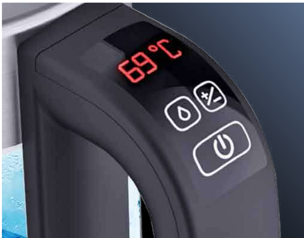
Сенсорное управление/ LED-дисплей